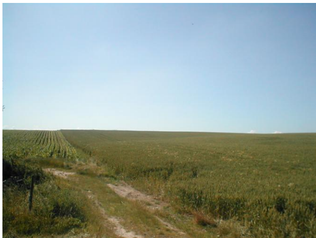
5 – Incision entre les parcelles de maïs et de blé.