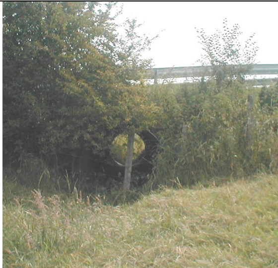
20 – Buse passant sous la D104