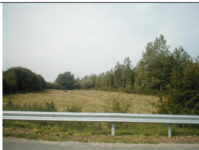
19 – Position du BdR en amont de la D104 (Vue depuis l'aval)