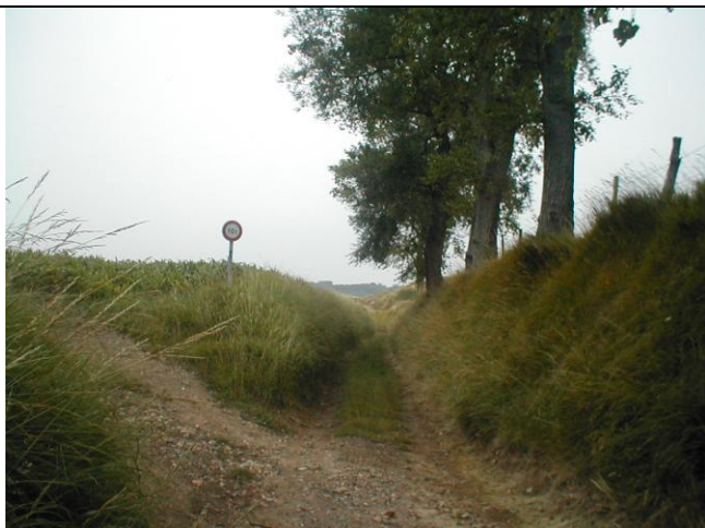
26 - Ravin Fond de Dohem et départ du chemin en rive droite