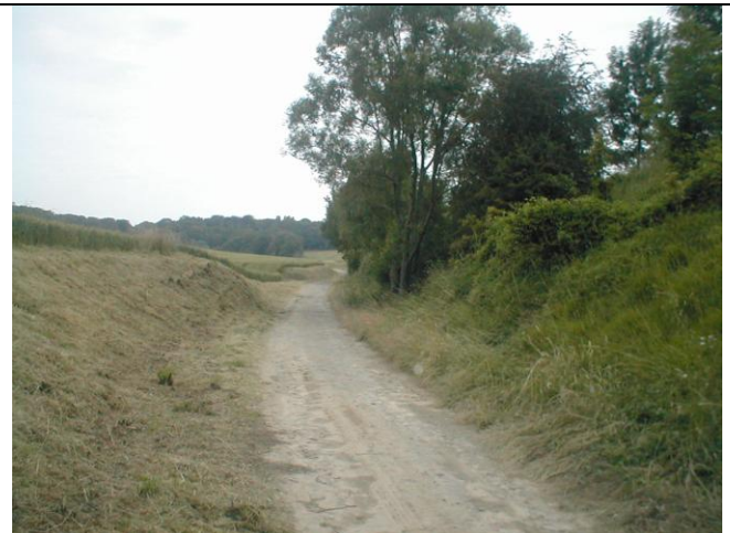
23 – Pli dans le chemin, talus de part et d'autre