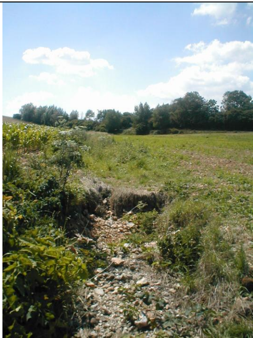
10 – Erosion du fond de talweg