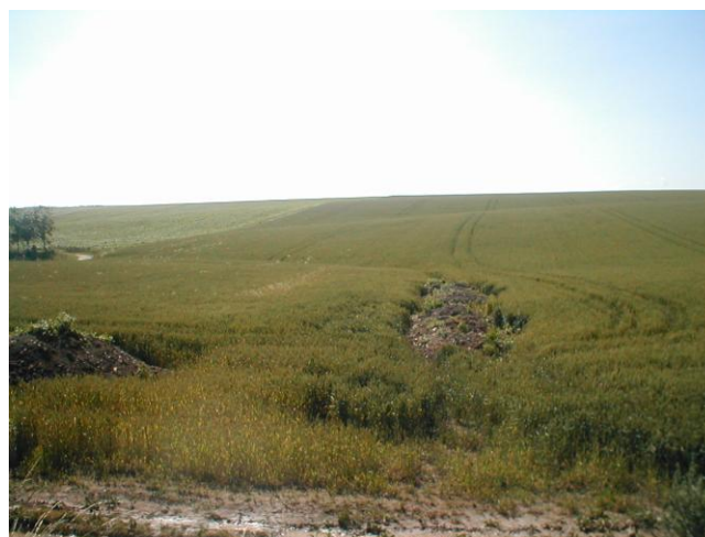
4 – ravinement comblé par un apport récent de terre