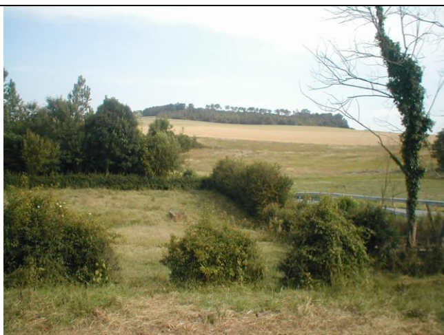
18 – Position du BdR en amont de la D104 (Vue depuis l'amont)