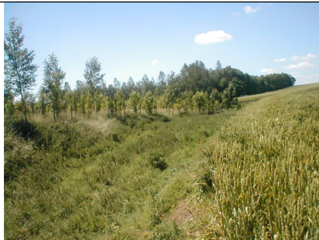
15 – Fond de talweg très large, enherbé