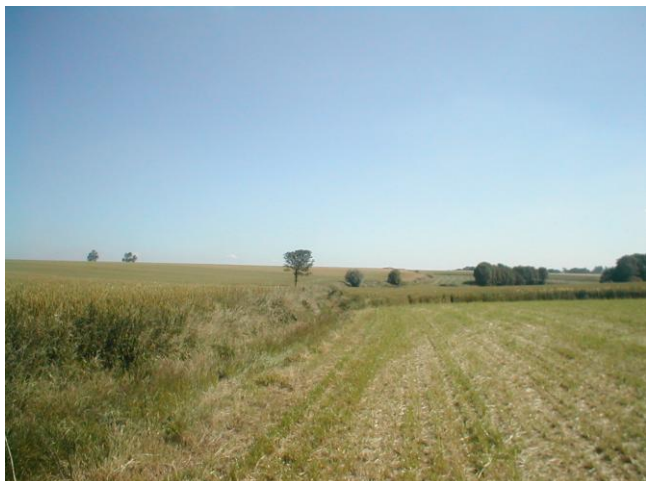
1 – BdR dans le chemin en creux