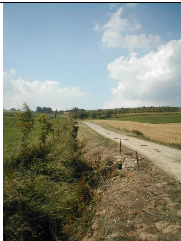
13 – Fossé raviné et départ de la buse sous la route