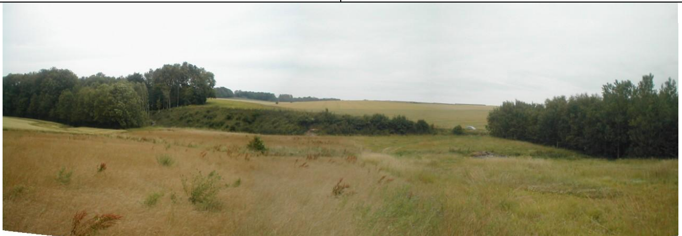
21 – Bassin de rétention 141 (vue de la rive droite, exutoire à droite de la photo dans les arbres)