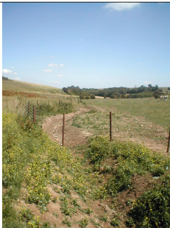
17 – Erosion dans le fond de talweg