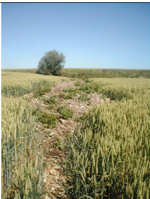
3 – Ravinement comblé par un apport récent de terre