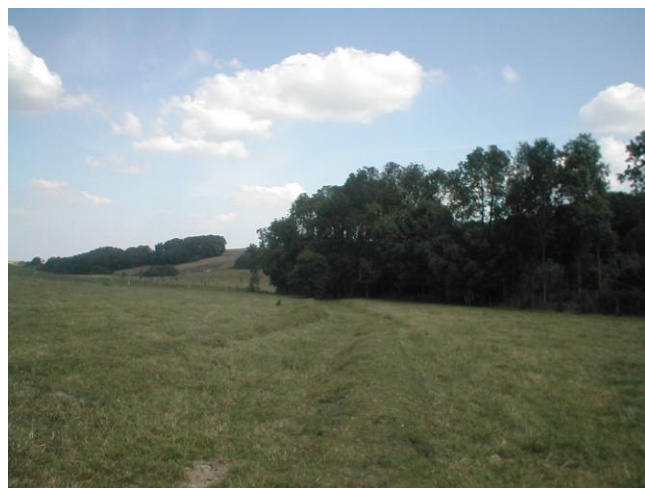
11 – Positionnement du BdR. Actuellement, deux petits talus guident les écoulements