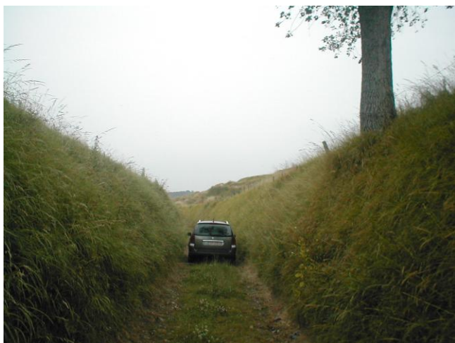
24 – Ravin Fond de Dohem