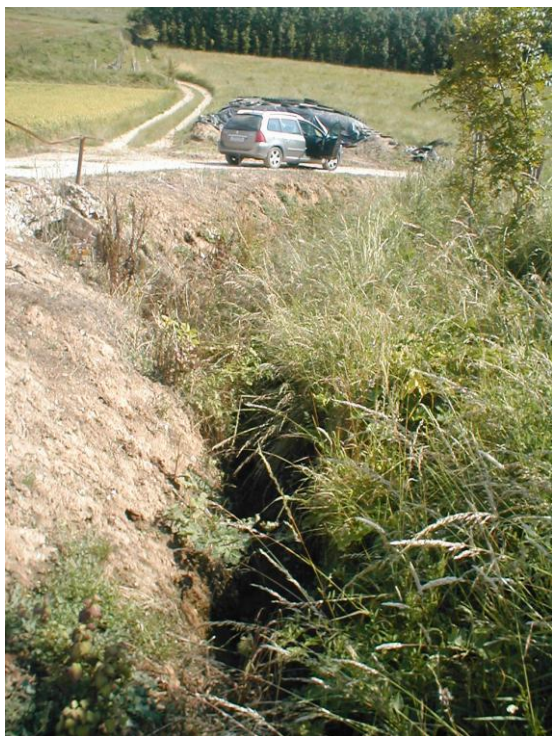
12 – Fossés profonds, ravinés