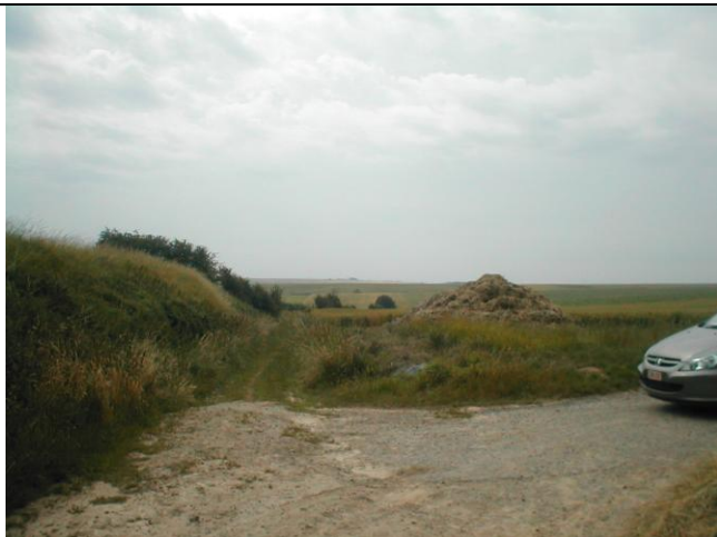
22 – Pli dans le chemin, talus en rive gauche