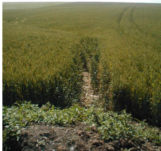
2 – Ravinement à l'exutoire, dans le fond de talweg