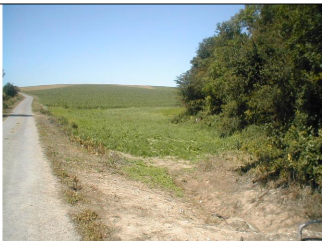
8 – Bassin amont (vue depuis la buse)