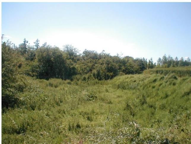
16 – Positionnement du BdR vue depuis l'aval