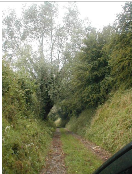
25 - Ravin Fond de Dohem