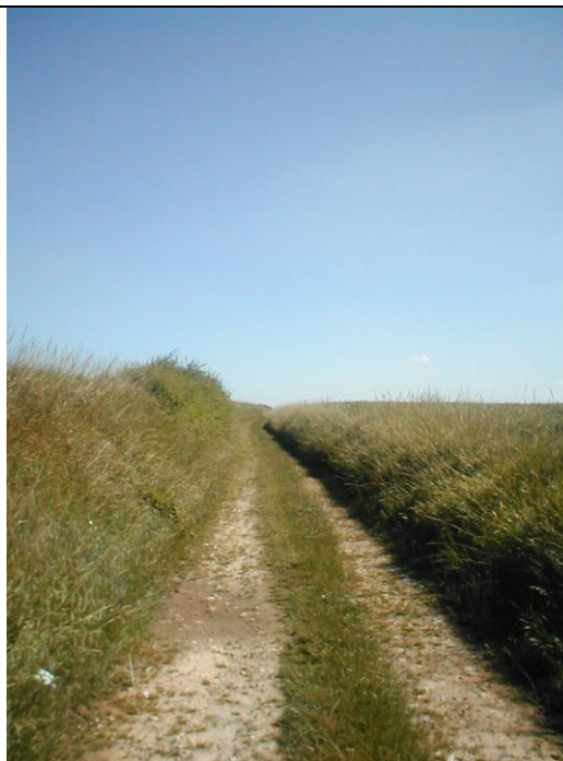
6 – Chemin en creux