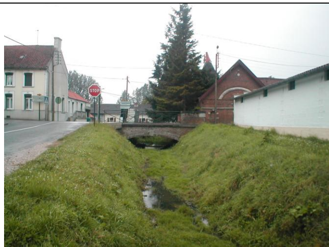
27 – Pont de la D157 sur le Ravin Fond de Dohem à l'entrée de Delettes