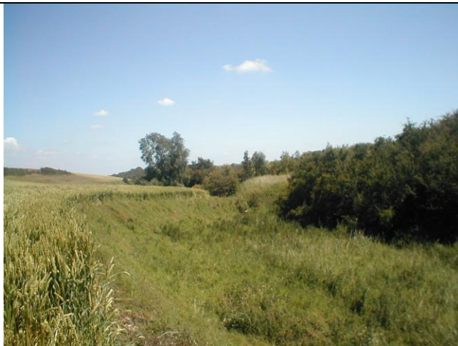
14 – Fond de talweg très large, enherbé