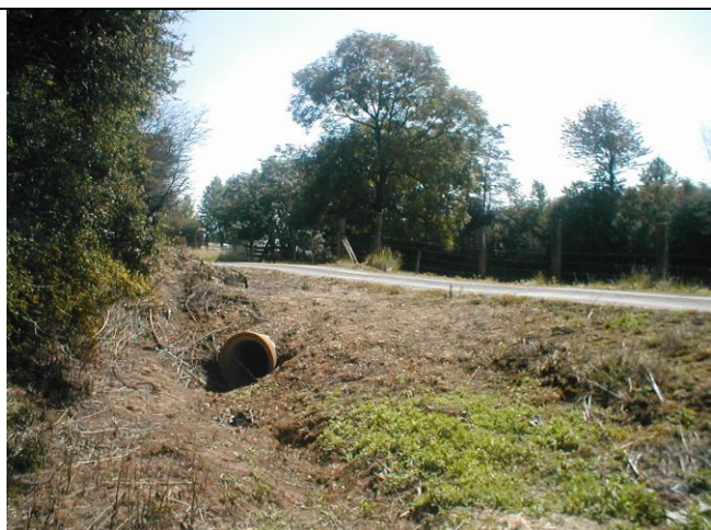
9 – Bassin amont : vue de la buse