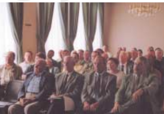
Réunion de fin d'étude des Canaux de la Bourre - Hazebrouck, 1 er juillet 2003